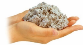
セルローズファイバー断熱材