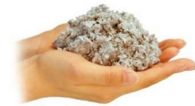
セルローズファイバー断熱材