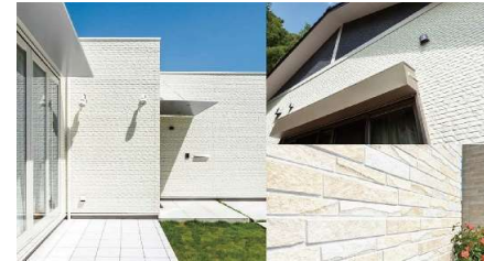
外壁:サイディング