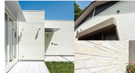
外壁:サイディング